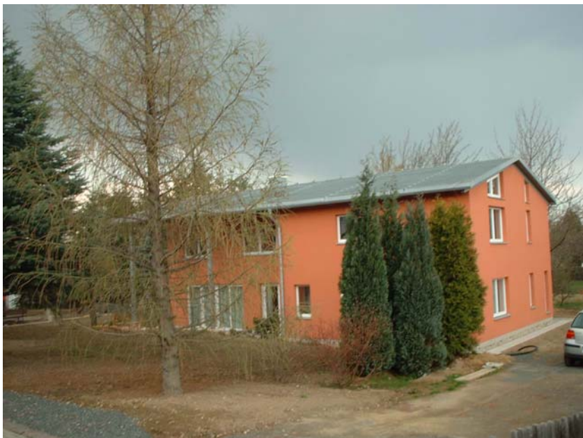
Abb. 1: Einfamilienhaus in Dresden mit 40 m 2 QUICKSTEP ® - Solarthermie Dachkollektor der Firma Rheinzink

Bei einem 2004 in Dresden errichteten Wohngebäude wurde ein Dachkollektor zur Erhöhung der Quellentemperatur der Wärmepumpe installiert und vermessen. Die Modemschnittstelle zum Datenlogger (Messwertetransport, Fernüberwachung, Fernsteuerung) liefert täglich 32 240 Messwerte, die von uns ausgewertet werden.