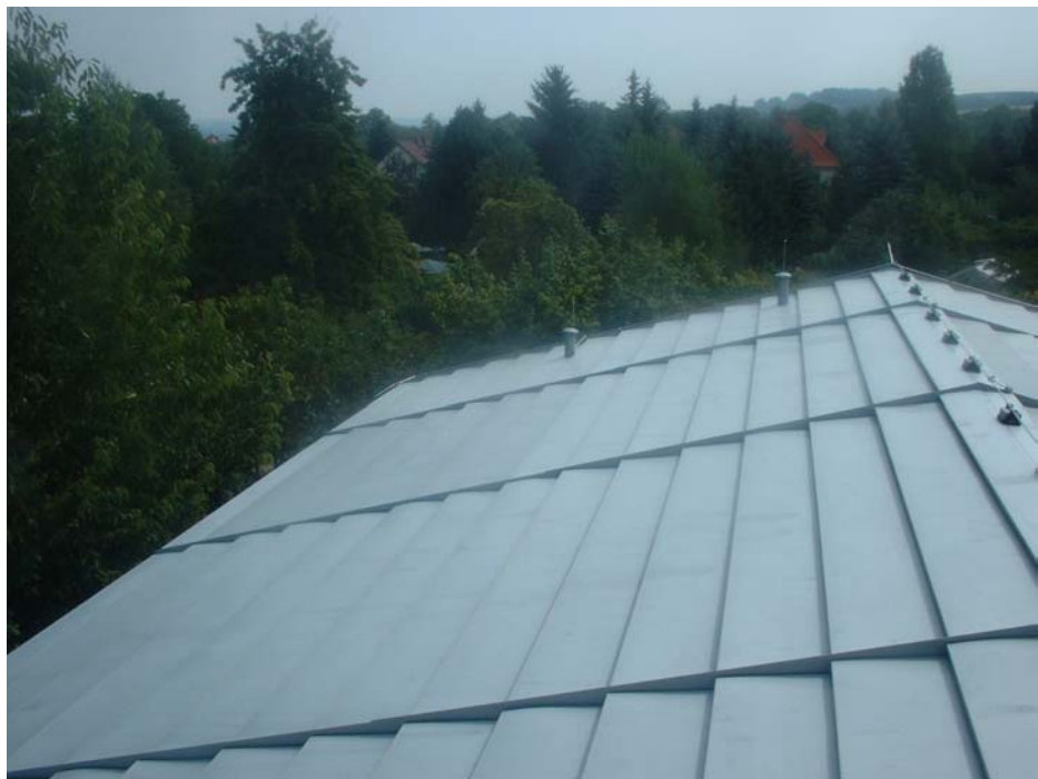
Abb. 2: Ansicht Dachabsorber

Durch die konkreten Dresdener Randbedingungen mit einem besonders günstigen Nachttarif für Wärmepumpen (22:00 bis 6:00 Uhr) wurde das Regelungsregime so gewählt, dass die nächtliche Wärmebereitstellung Priorität gegenüber dem Tagesbetrieb hat. Deshalb sind auch die sommerlichen Messergebnisse nicht repräsentativ für die solare Kopplung. Andere Tarifbedingungen würden also zu höheren solaren Erträgen und noch besseren Jahresarbeitszahlen führen.